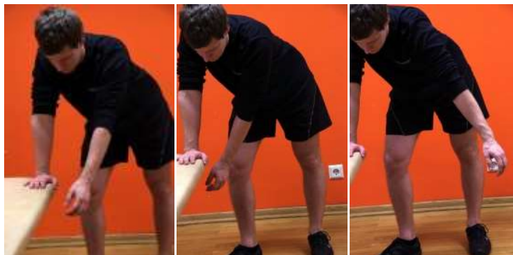
Ringid mõlemas suunas; 2-3 minutit; 3-5 korda päevas